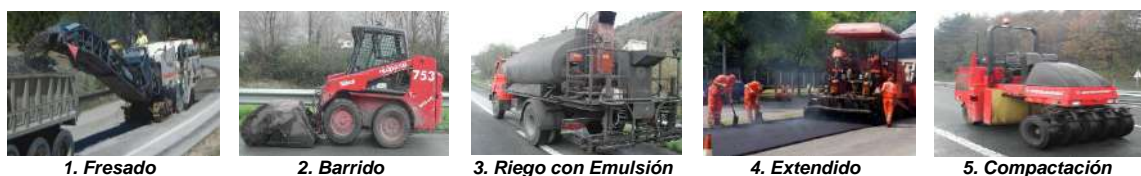
Figura 4. Puesta en Obra de la Mezcla Asfáltica

Las plantas dan servicio a obras ubicadas en un radio en torno a 100 km. La mezcla asfáltica es transportada en un camión basculante y cubierto hasta el tajo. De forma previa al extendido se procede al fresado, dependiendo de la tipología de la obra puede o no existir esta etapa, y el barrido de la superficie asfaltada. La fresadora rompe el asfalto en fracciones que son recogidas en un camión bañera. Una vez que la fresadora ha retirado la capa de asfalto correspondiente y la barredora ha dejado la superficie limpia, se procede al riego con emulsión. Este riego asegura una buena adherencia entre la nueva capa que se va a extender y la superficie sobre la que se va a extender. Posteriormente se realiza la descarga del material del camión a la extendidora y se procede al extendido de la mezcla bituminosa. Finalmente se realiza la compactación de la superficie asfaltada. Mediante la compactación se logra que la mezcla llegue a la densidad requerida evitando irregularidades superficiales consiguiendo así un acabado que permita aportar a la mezcla la durabilidad deseada.