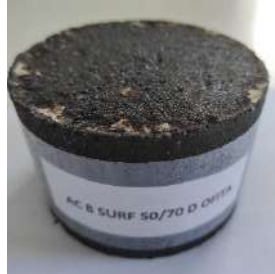
Figura2. Mezcla Asfáltica AC8SURF 50/70 D OFITA

La mezcla bituminosa analizada es la AC8SURF 50/70 D OFITA: Mezcla bituminosa en caliente sin fresado.