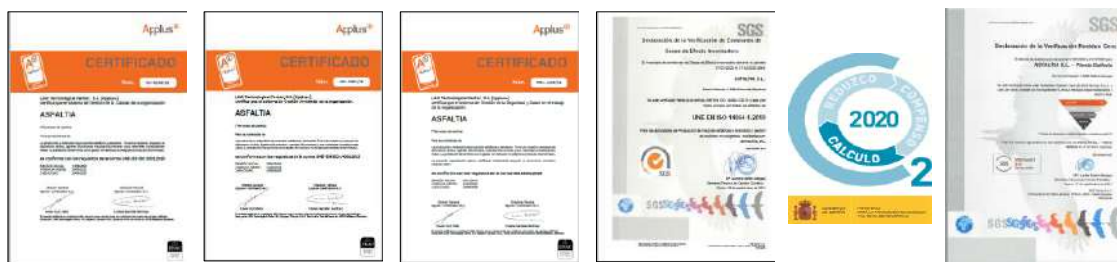
Figura1. Certificaciones ISO 9001, ISO 14001, ISO 45.001, Huella de Carbono de organización y Zero Waste de ASFALTIA S.L.

Asfaltia, además de producir mezclas bituminosas, ofrece servicios de mantenimiento y conservación. Dispone de un amplio parque de maquinaria compuesto por extendedoras, silo de transferencia, apisonadoras, compactadoras, fresadoras, barredoras y demás maquinaria auxiliar que la capacitan para acometer trabajos de pavimentación de la más diversa tipología: pavimentos drenantes, aglomerados de asfalto impresos y en color, sonoreductoras, carriles bicicleta, mezclas ecológicas reciclables, firmes de gran calidad y precisión geométrica para pistas deportivas de alta competición, pavimentos que mejoran la adherencia de los vehículos, parques públicos, entre otros.